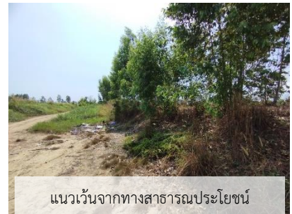
แนวเว้นจากทางสาธารณประโยชน์