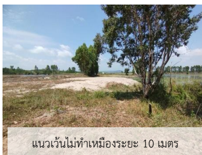
แนวเว้นไม้ทำเหมืองระยะ 10 เมตร